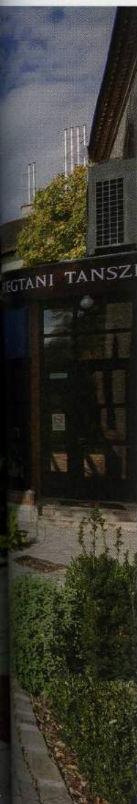
A campus parkja ősszel is ápolt

Az oktatási paletta szélesítése elengedhetetlen a dékán szerint, hiszen az állatorvoslás jelentősen megváltozott az elmúlt huszonöt évben. A fálvaktól az uniós csatlakozás után nagyrészt kikopott az állattartás, a több száz állatot tartó telepeken és baromfigyárakban másfajta képzettségre is szükség van, mint korábban. Az összezárttság és a szűk élettér, valamint a szabad tartástól eltérő táplálás számlájára írható betegségek terjedésének megakadályozása kemény próbatétel minden állatorvos számára. Ráadásul egyre többen tartanak otthon egzotikus állatokat, és Európa-szerte szaporodnak a vadasparkok, terebélyesednek az állatkertek. Lakóik gyógyításához komoly tudásra van szükség. Az ismeretanyag elsajátításához azonban van segítség. Az állatorvoslást tanító professzorok nemzedékei tekintélyes tudást halmoztak fel az eltelt bő két évszázad alatt. Mintha tudták volna, hogy ők adják a törzsét annak a terebélyes fának, amelynek az itt tanuló és végzett hallgatók adják a koronáját. Bár, mert szemmel láthatóan hosszú távra építkeztek ők is, lehet, hogy mindezt látták előre. ■