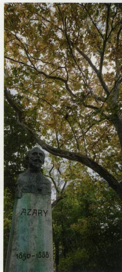
Azary Ákos szobra közadakozásból készült