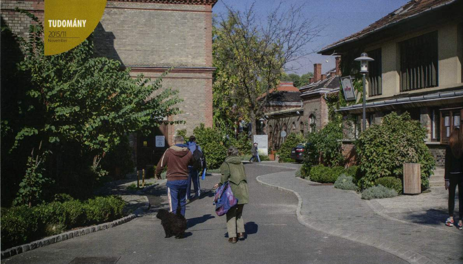
A pavilonok többsége Steidl Imre tervei alapján épült