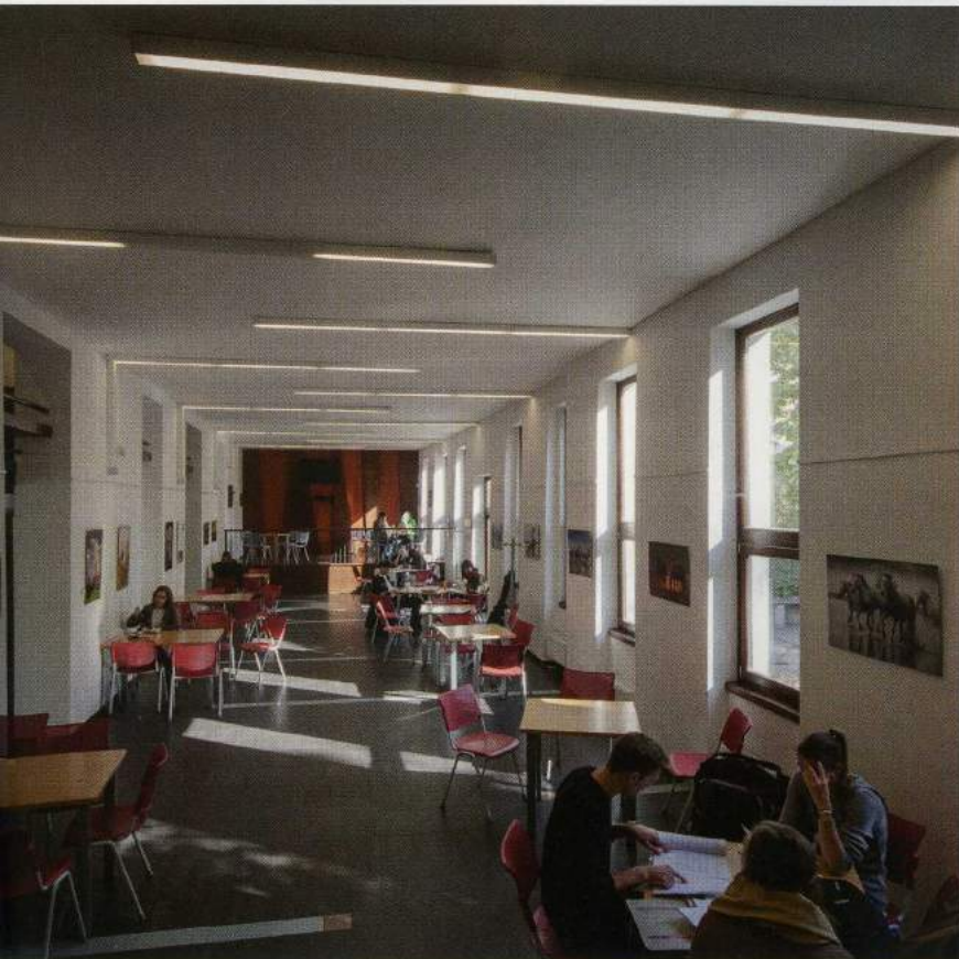
Még nem jött el a pihenés ideje