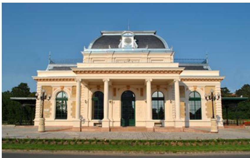
Gödöllő – vasúti királyi váró