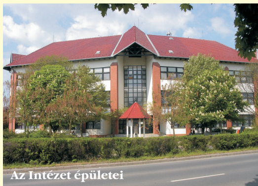
Az Intézet épületei

Tervezzük master szakok indítását és az egészséges élelmzéshez kapcsolódó tudományos kutatások, széleskörű nemzetközi együttműködések is segítik, hogy Intézetünk a jövőt hordozó gazdasági-társadalmi változások fő folyamataihoz kapcsolódjon.