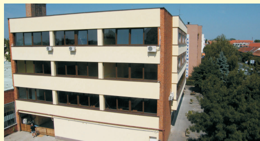
Az Intézet Nyílt Napjait 2010. január 20-án, és február 3-án 10 órakor tartjuk Gyulán, a Szent István út 17-19. szám alatti épületben.

7. A jól szervezett intézményben az országban a legolcsóbbak közé tartozó költségtérítések vannak!